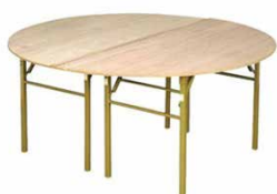
02 ベニヤ丸テーブル 1500