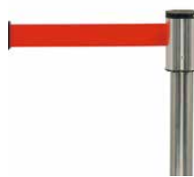
15 ベルトパーティション 2000

●サイズ：W2,400×D1,200×H200/400(切り替え式) ●収納時サイズ：W1,200×D540×H1,300 ●重量：110kg ●天板：合板 ※有料付属：スカート 茶色 サテン布地(1枚4.8m) 2,000円(税別)