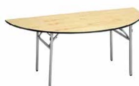
03 6尺半円テーブル (1/2)