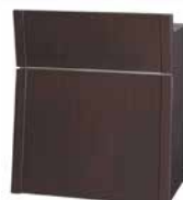
11 演台 (W900 ブラウン C付)