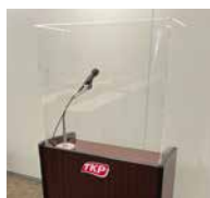
10 演台用 アクリルボード

●サイズ：W900 × D350 × H1,797 ●重量：約 8.2kg ●材質：透明アクリル樹脂(板面)、アルミ(フレーム) ●キャスター付き