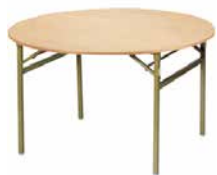
01 ベニヤ丸テーブル 1200