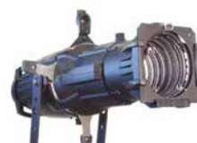
16 スポットライト CSPOT36

●ベルトサイズ：L 2,000 ●色：赤のみ ※最低 2本以上でご利用になります。