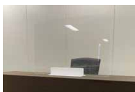
05 飛沫防止 アクリルスタンド

●サイズ、柄、色等ご希望に合わせてご用意いたします。内容、料金についてはお問い合わせください。