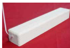
07 アクリルボード連結用土台 垂木(溝3mm)

●材質：アクリル樹脂版 ●飛沫防止アクリルスタンド、アクリルボード連結用土台垂木(溝3mm)と組み合わせてご使用ください。 ●4つ切り/6つ切り対応