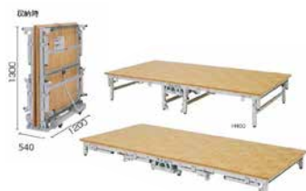
14 簡易ステージ CW2400D1200H200/400

●サイズ：W600 × D450 × H1,100(棚面1,000) ●色：ローズ