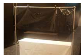
08 受付用 飛沫防止シート

●材質：アクリル樹脂版 ●飛沫防止アクリルスタンド、アクリルボード連結用土台円柱(溝3mm)と組み合わせてご使用ください。