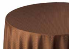
04 テーブルクロス 各種