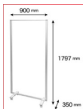
09 C付透明アクリルパーティションVV

●サイズ：W1,800×H1,800(スタンド)、W1,800×H900(シート) ●材質：軟質塩化ビニール(シート) ●セット内容：透明シート1枚/ポール3本/ベース2個/連結用金具2個/目玉クリップ5個